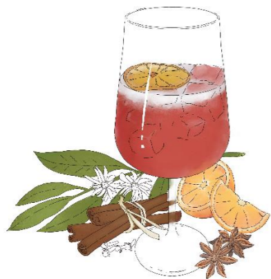
Nourigroni (Bitter Bianco, Gin, Kamille)