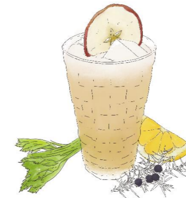
Je m'apple Célerie (Alkoholfreier Gin, Apfel, Sellerie, Zitrone)