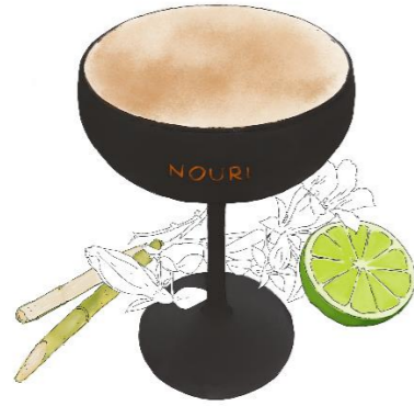
Dirty Dirty Tini (Gin, Olive, Limettencordial)