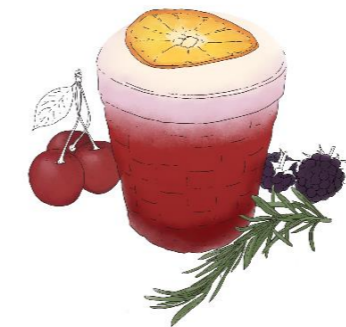
kHirschsprung alkoholfrei (Alkoholfreier Wermut, Brombeere, Kirsche, Rosmarin, Zitrone, Foamer)