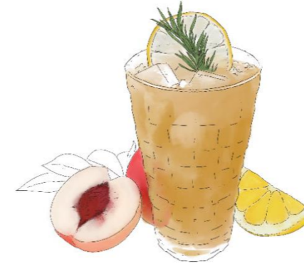
Open Door alkoholfrei (Alkoholfreier Wermut, Rosmarin, Zitrone, White Peach)